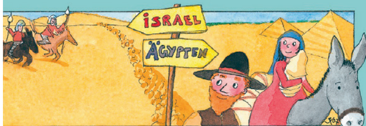
Auflösung: Ein Engel.

aus der christlichen Kinderzeitschrift Benjamin