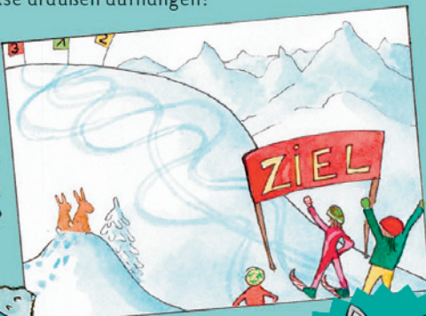
Der Skifahrer mit der Startnummer 1.

Rästel: Wer ist im Rennen die kürzeste Strecke gefahren?